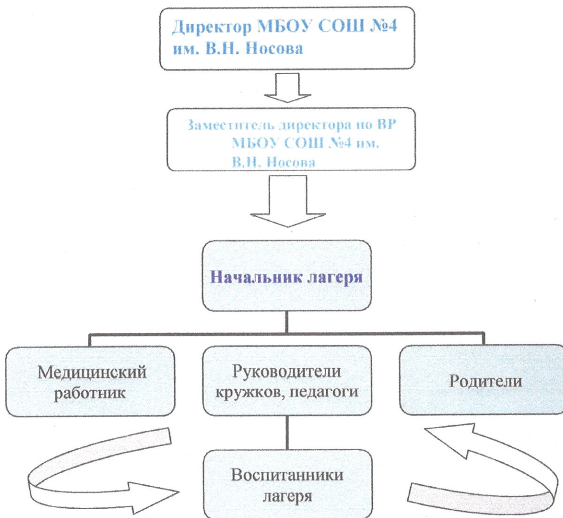
Схема управления программой